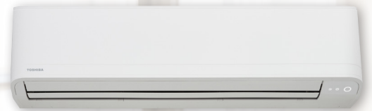
RAV-KRTP model 1101 (GM en GP)